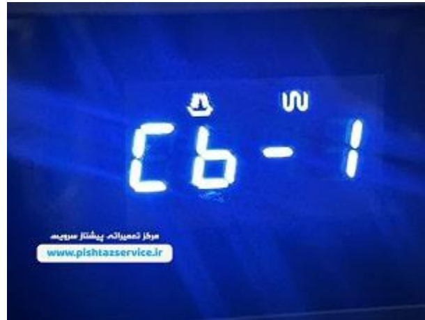
دفترچه راهنمای ماکروفر سامسونگ