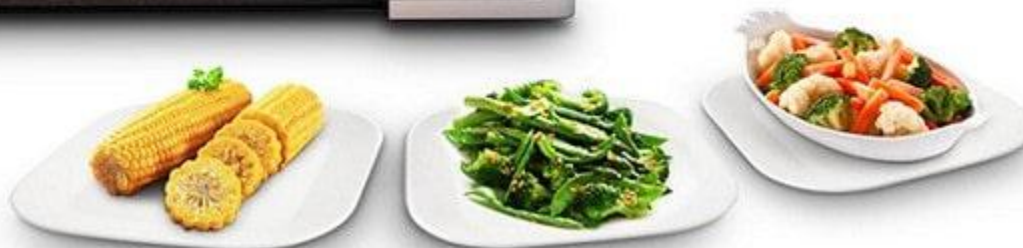
دفترچه راهنمای ماکروفر سامسونگ

وبسایت خدمات پس از فروش سامسونگ www.pishtazservice.ir