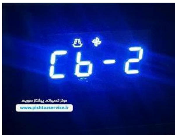
دفترچه راهنمای ماکروفر سامسونگ