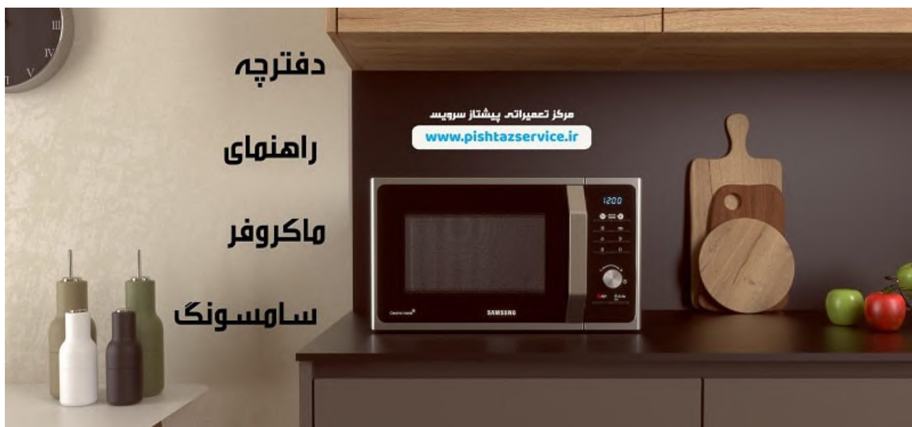
دفترچه راهنمای ماکروفر سامسونگ