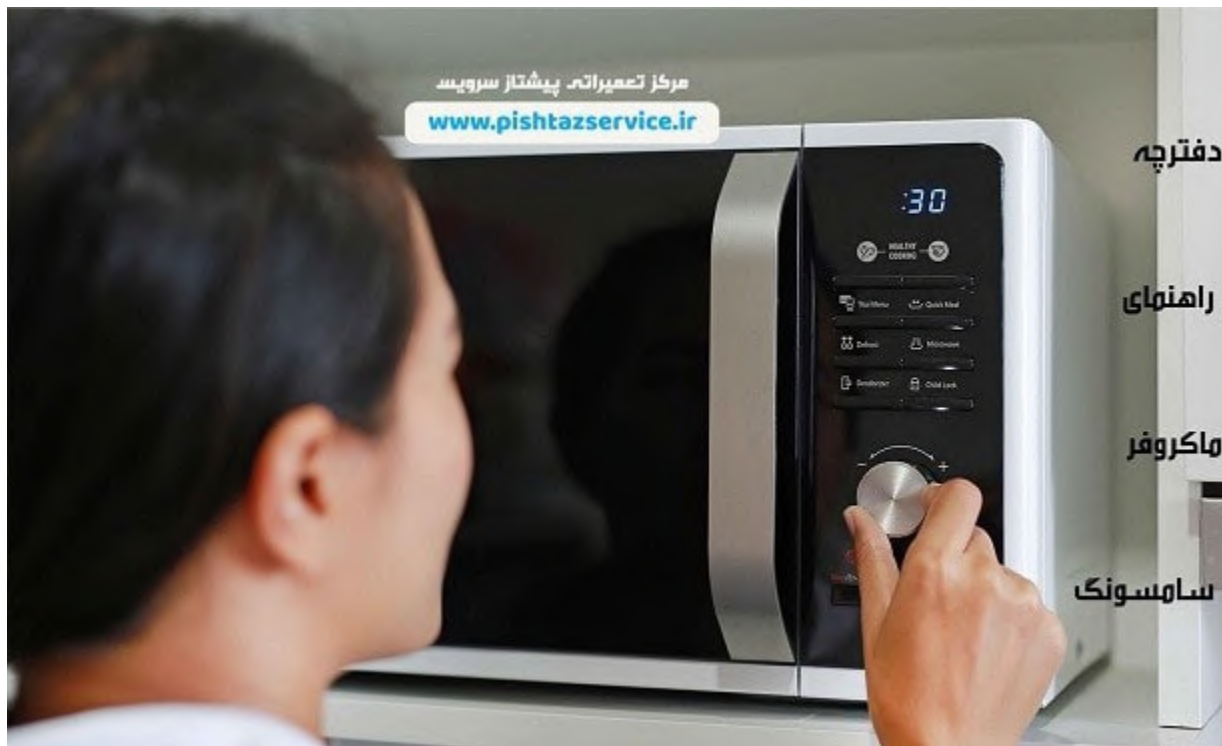
دفترچه راهنمای ماکروفر سامسونگ

در نظر داشته باشید برای استفاده از این منو داخل دستگاه می بایست خالی باشد.