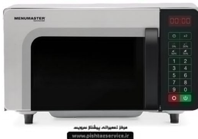
نمایندگی تعمیر ماکروفر منومستر