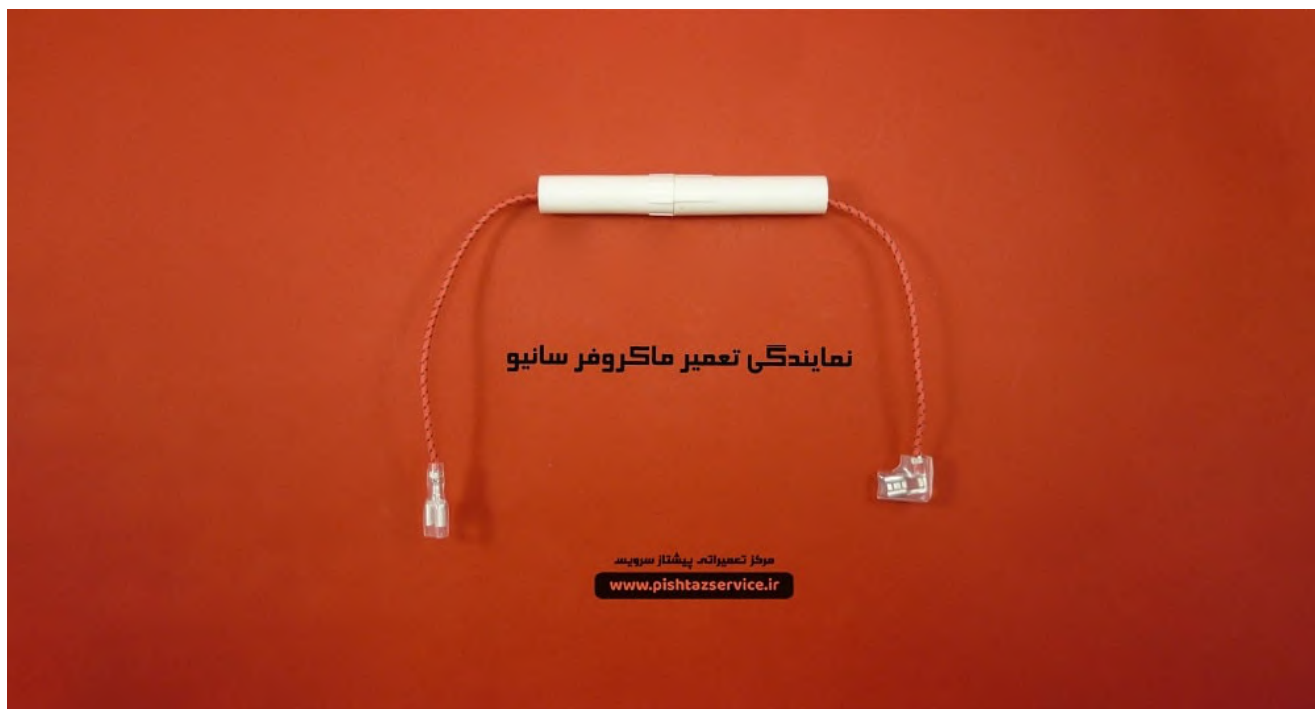
نمایندگی تعمیر ماکروفر سانئو