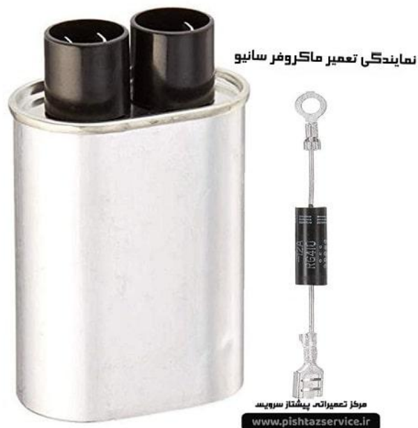
نمایندگی تعمیر ماکروفر سانئو