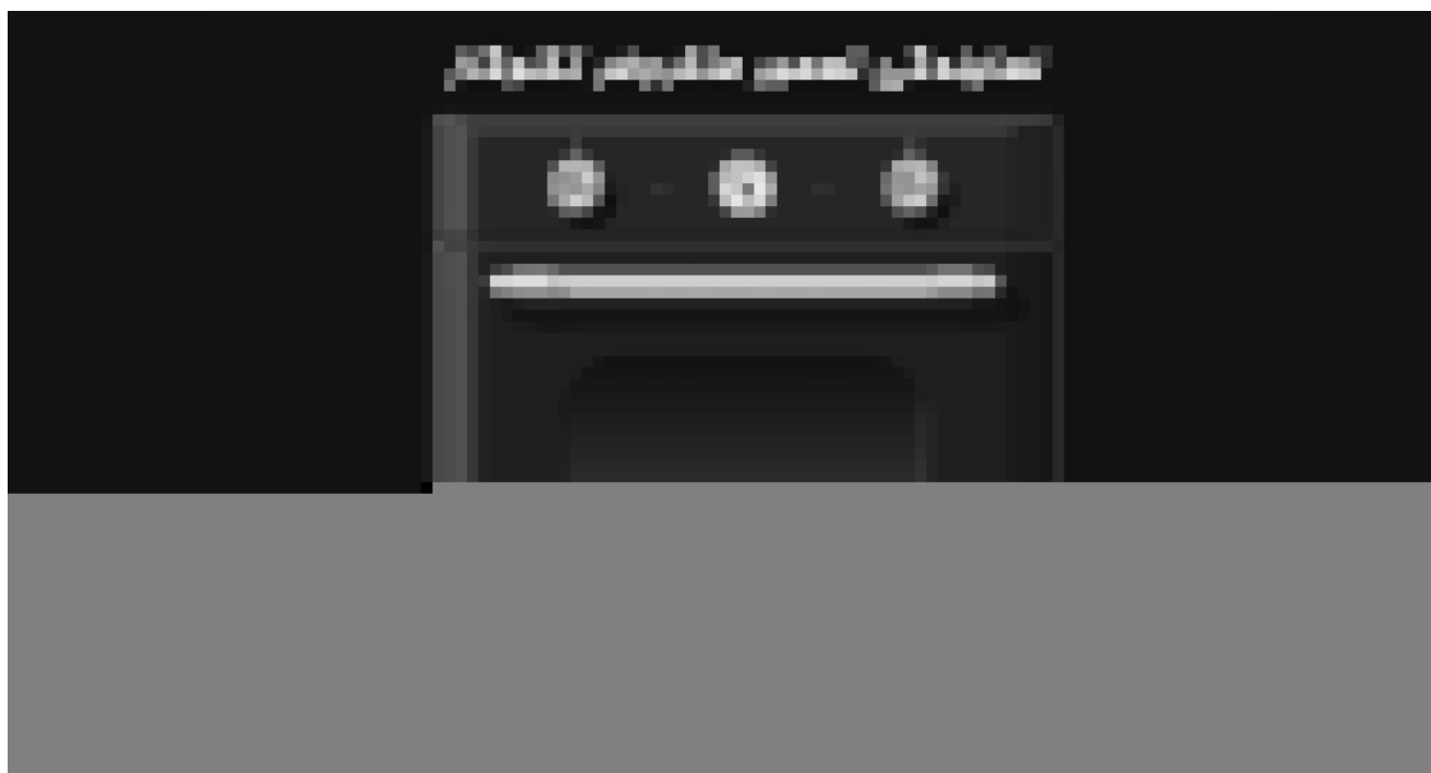
نماینده‌گی تعمیر ماکروفر تکنوگاز