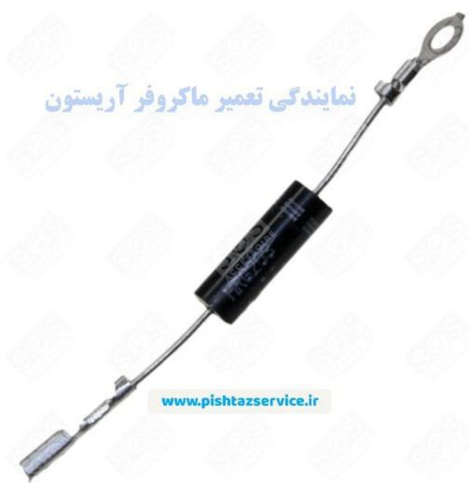
نمایندگی تعمیر ماکروفر آریستون