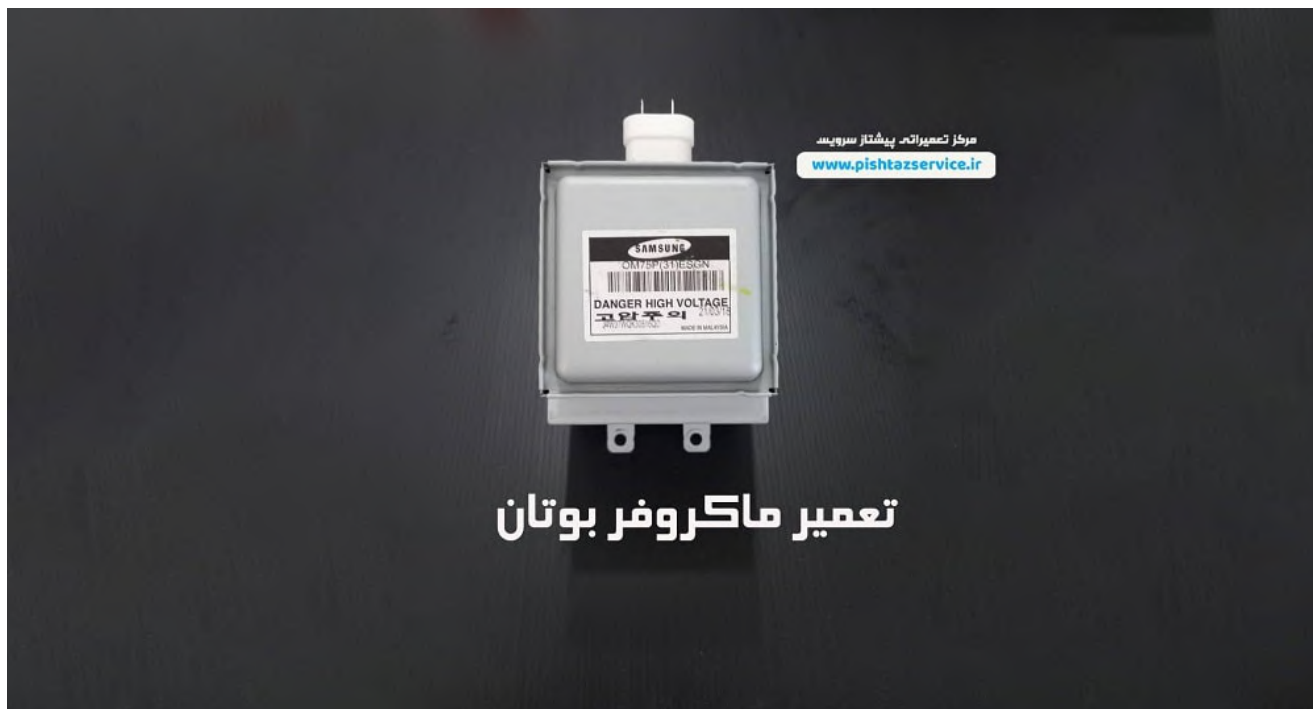
تعمیر ماکروفر بوتان

خرابی المنت های ماکروفر بوتان نیز از دیگر دلایل جرقه زدن ماکروفر فوما می باشد. برای رفع جرقه زدن ماکروفر بوتان با نمایندگی تعمیر سولاردوم فوما در تهران تماس حاصل نمایید. در نظر داشته باشید تعمیرکار مایکروفر بوتان در کمتر از یک ساعت با شما تماس گرفته و در محل حاضر می باشد.