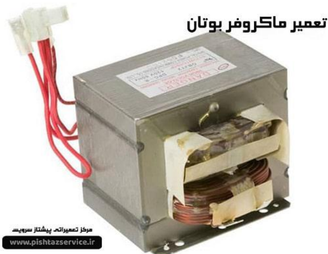
ترانس ماکروفر بوتان