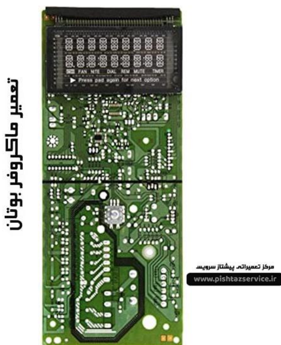
تعمیر ماکروفر بوتان