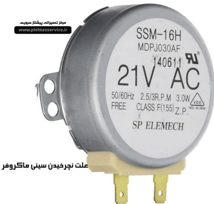
“علت نچرخیدن سینی ماکروفر”

در صورت تمایل به استعلام قیمت قطعات با کارشناسان ما در پیشتاز سرویس تماس بگیرید.