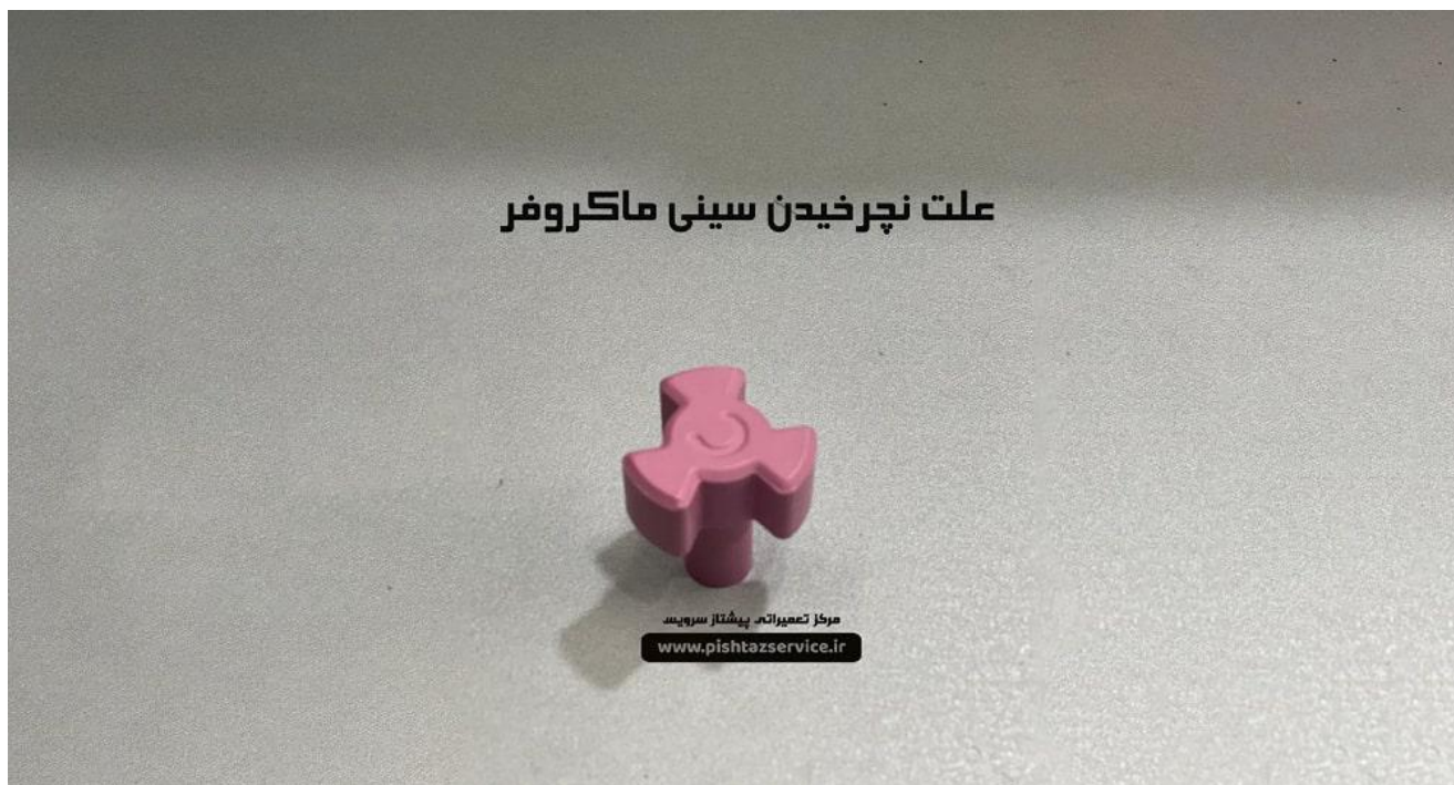
علت نچرخیدن سینی ماکروفر

مدل دوم هم از جنس سرامیک می باشد ولی از وزن کمتری برخوردار است و طبیعا کیفیت پایین تری هم دارد.