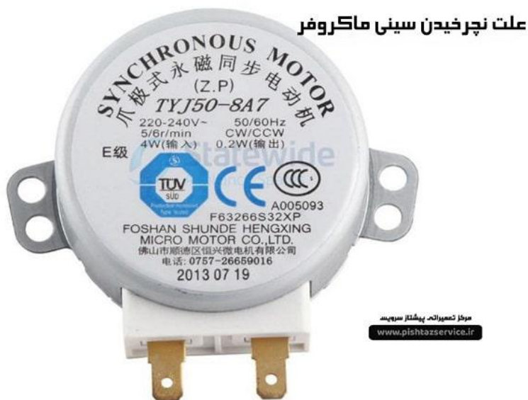
علت نچرخیدن سینی ماکروفر

از مدل های دیگر موتور کف که مصرف کمتری دارند می توان به موتور کف با قدرت 21 ولت اشاره کرد که در دستگاههای بوتان، سامسونگ و در موارد بسیار کمی ال جی مشاهده می شود اشاره کرد.