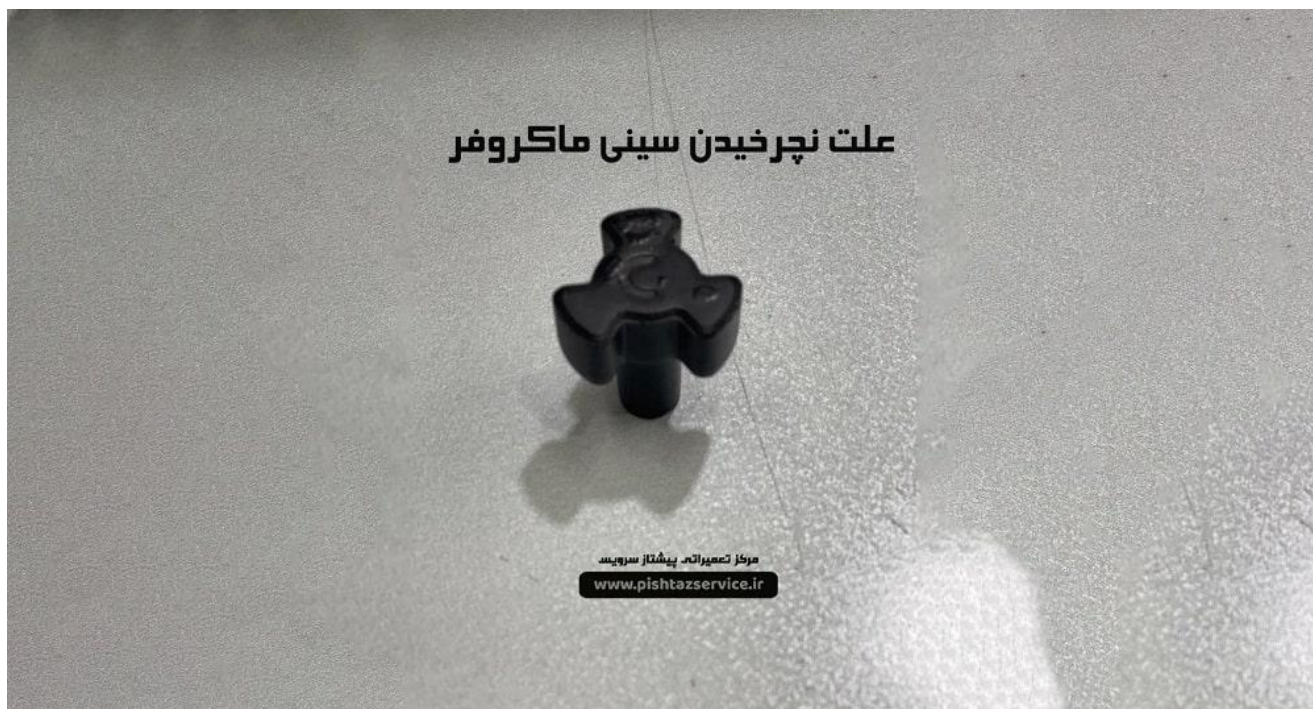
علت نچرخیدن سینی ماکروفر

برای ثبت سفارش با همکاران ما تماس حاصل فرمایید و یا با مراجعه به وبسایت درخواست تعمیرات خود را به صورت آنلاین ثبت کنید.