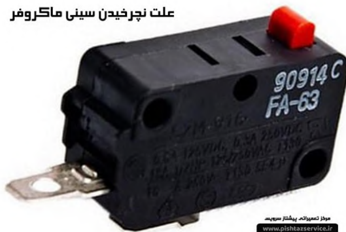
علت نچرخیدن سینی ماکروفر