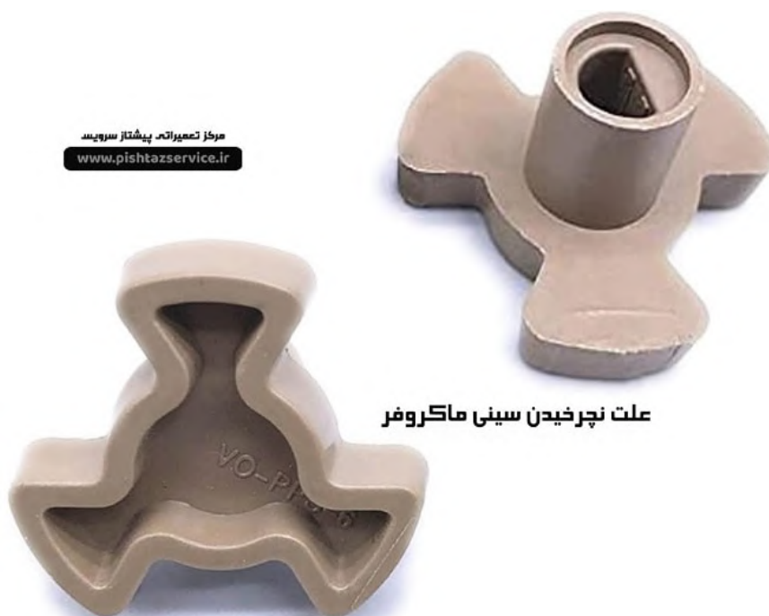
علت نچرخیدن سینی ماکروفر

در ادامه بررسی علت نچرخیدن سینی ماکروفر به قطعه شفت دستگام می رسیم که ممکن است در اثر شکستگی عمل چرخیدن انجام نپذیرد و در دستگامهای معمولی که اکثرا دارای سینی شیشه ای می باشند از کوپلینگ های پلاستیکی استفاده می شود که ممکن است در اثر استفاده زیاد و طول عمر استفاده از آن دچار شکستگی شود و احتیاج به تعویض پیدا کند.