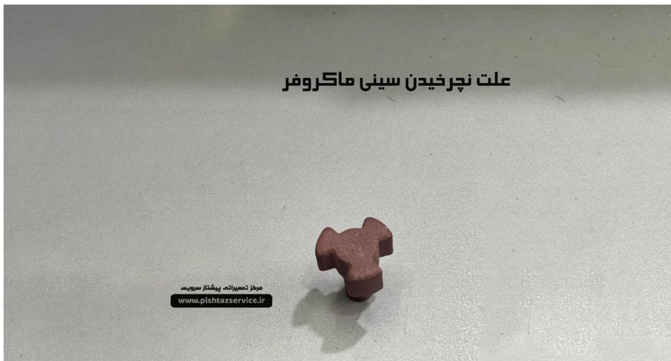
علت نچرخیدن سینی ماکروفر

مدل دوم هم از جنس سرامیک می باشد ولی از وزن کمتری برخوردار است و طبیعا کیفیت پایین تری هم دارد.