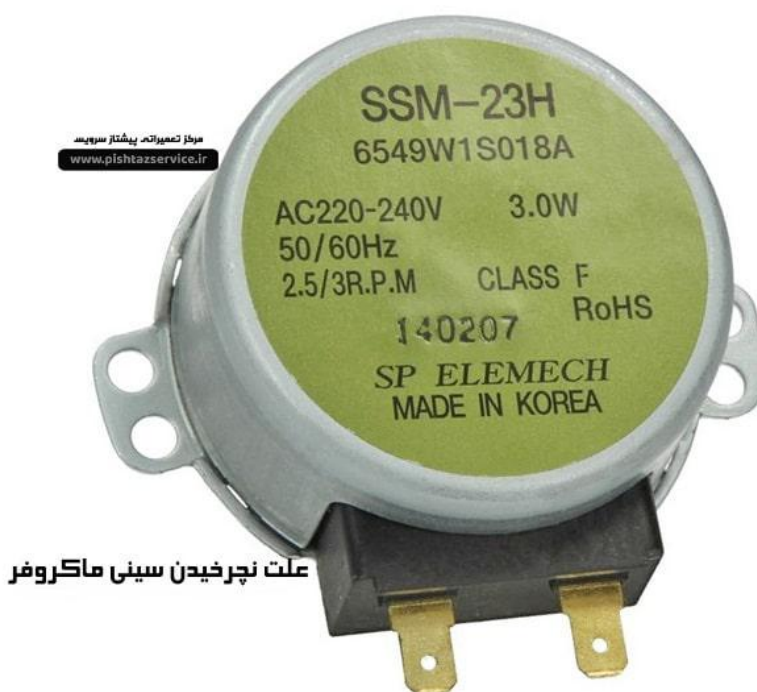
علت نچرخیدن سینی ماکروفر