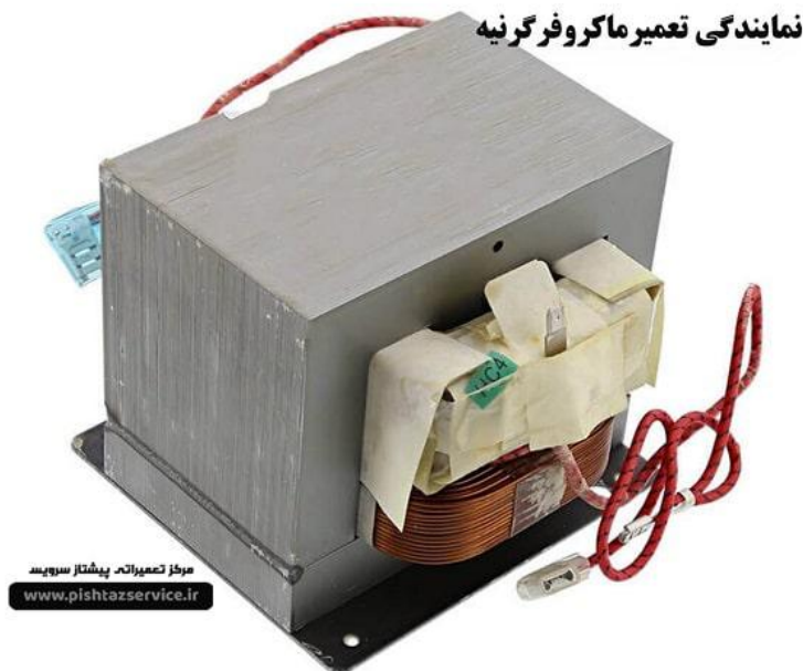
نمایندگی تعمیر ماکروفر گرنیه