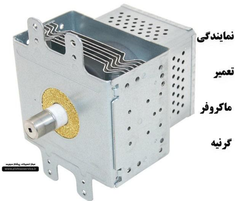
نماینده تعمیر ماکروفر گرنیه

تعمیر ماکروفر گرنیه توسط تکنسین های پیشتاز سرویس در کمترین زمان ممکن صورت می پذیرد و در نظر داشته باشید دستکاری افراد متفرقه باعث خرابی بیشتر و آسیب دیدن قطعات سالم می شود.