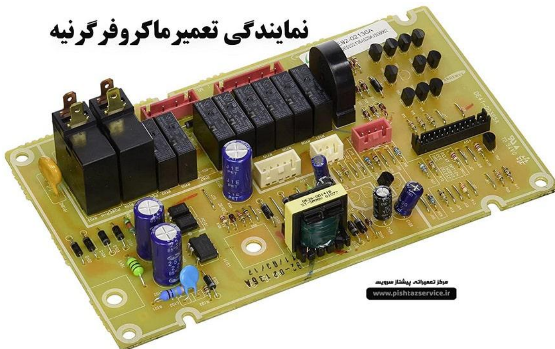
نمایندگی تعمیر ماکروفر گرنیه

نکته ای که میتوان در تعمیر ماکروفر گرنیه به آن اشاره کرد در خصوص ماکروفرهای اینورتر گرنیه خرابی پریدن فیوز به علت استفاده از سیستم اینورتر بسیار بیشتر مشاهده شده و سیستم اینورتر حتما باید توسط نمایندگی تعمیر ماکروفر گرنیه مورد بررسی قرار گیرد.