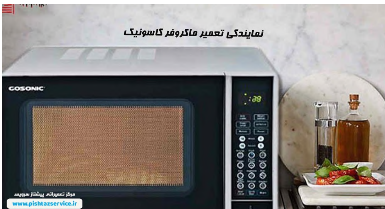
نمایندگی تعمیر ماکروفر گاسونیک

تقریباً نود درصد درخواست های مشتریان نمایندگی تعمیرات ماکروفر گاسونیک مربوط به خرابی های ذکر شده میباشد، حال ما قصد داریم توسط تعمیرکار ماکروفر گاسونیک علت این خرابی ها را برای شما شرح دهیم تا در صورت داشتن تخصص و مهارت لازم و با استفاده از ایمنی کامل خود برای تعمیر ماکروفر در محل دست به کار شوید. البته حتما توجه داشته باشید ماکروفر به علت تولید برق ۲۲۰۰ ولت بسیار خطرناک بوده و برای تعمیر ماکروفر گاسونیک حتما با تعمیرکار ماکروفر گاسونیک و پشتیبانی خدمات ماکروفر گاسونیک در ارتباط باشید، همچنین میتوانید قطعات یدکی را از پیشتاز سرویس به عنوان نمایندگی تعمیر ماکروفر گاسونیک تهیه نمایید.