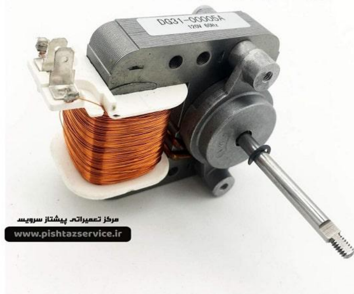
موتور فن خنک کننده