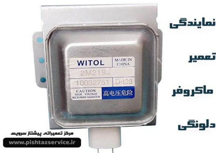
نمایندگی تعمیر ماکروفر دلونگی