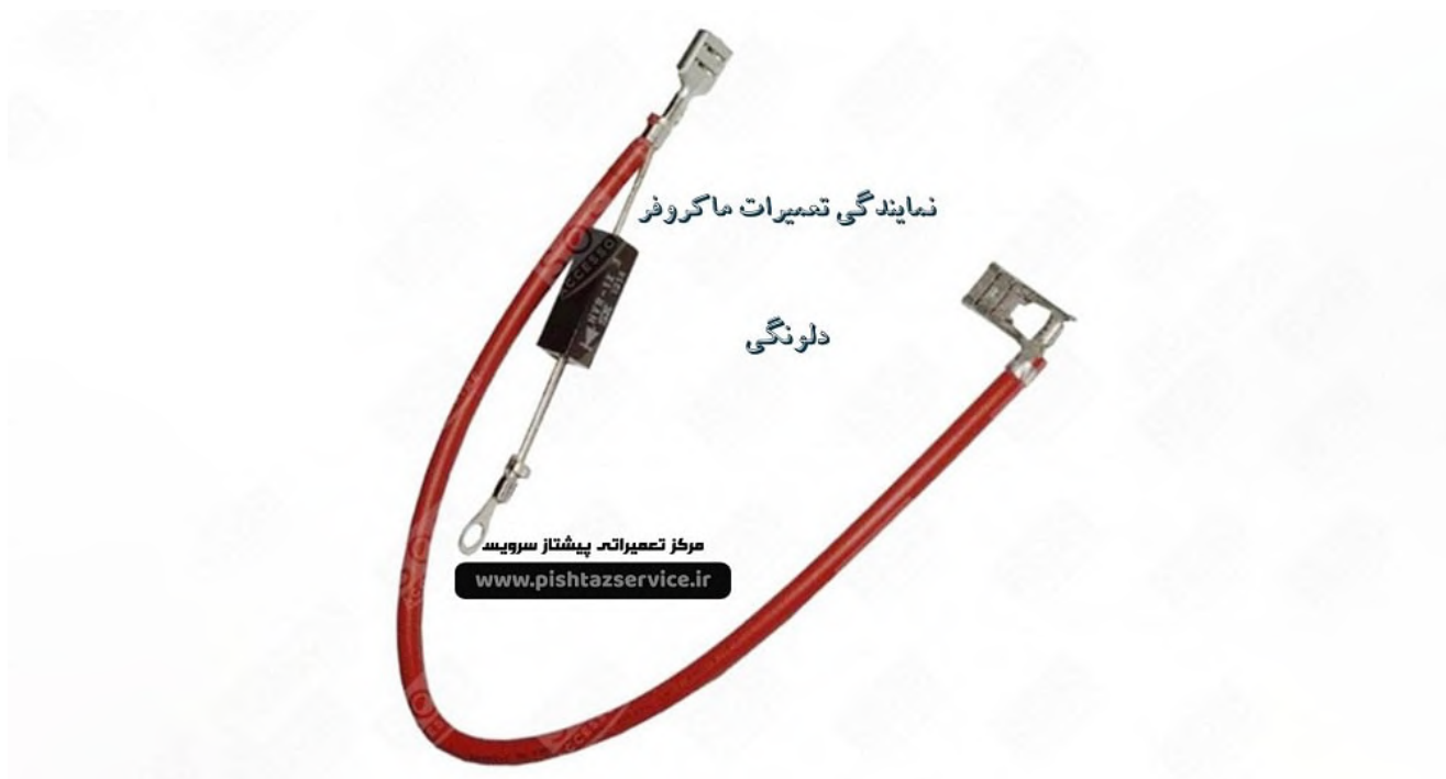
نمایندگی تعمیر ماکروفر دلونگی