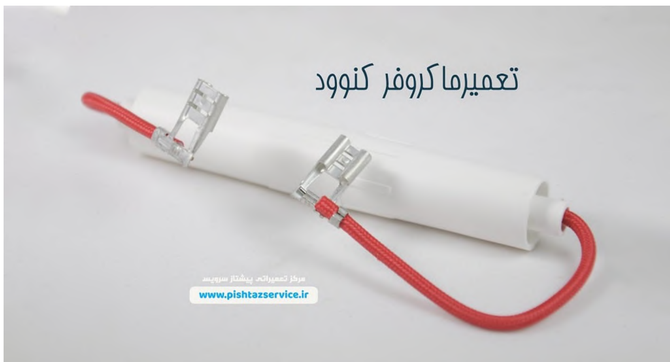
تعمیرات ماکروفر کنوود