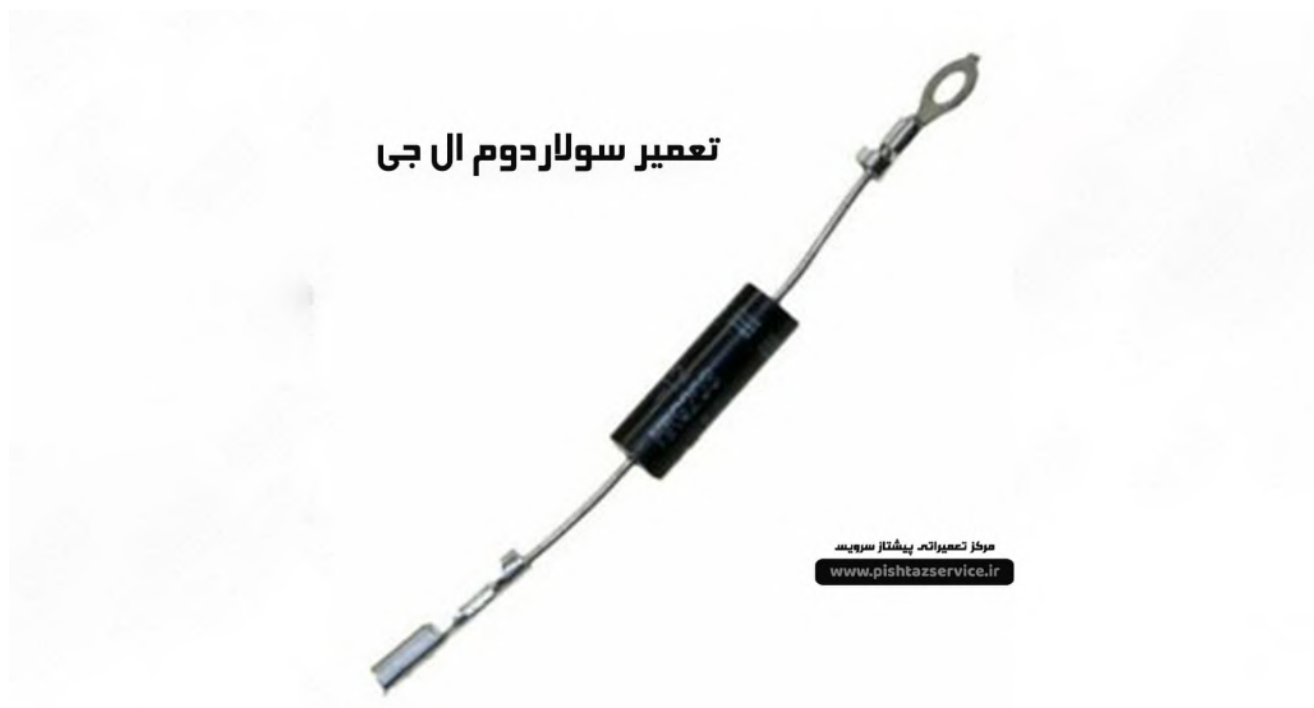
دید سولاردوم ال جی

بعد از موارد گفته شده در ابتدای مقاله را بررسی کردید و دستگاه عملکرد درستی همچنان نداشت با تماس یا ثبت سفارش آنلاین می‌توانید تعمیرکاران حرفه‌ای پشتیبان سرویس را در محل اعزام کرده و تعمیری با کیفیت و با ضمانت اصالت کالا به همراه گارانتی ۶ ماه تا یک سال را تجربه نمایید.