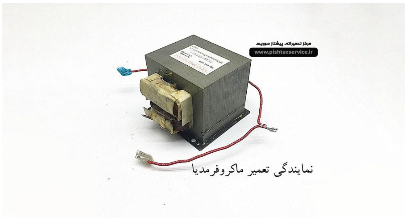
نمایندگی تعمیرات ماکروفر مدیا

قطعات نام برده بدون داشتن ابزار تخصصی قابل تست نبوده و توصیه می شود برای بررسی بیشتر با نزدیک ترین مرکز نمایندگی تعمیرات ماکروفر مدیا در تهران تماس حاصل فرمائید .