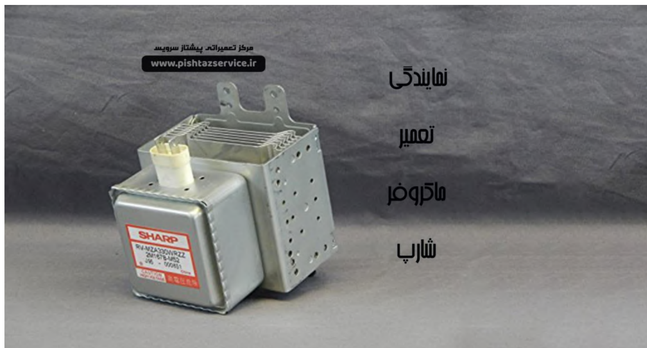
نمایندگی تعمیر مایکروفر شارپ

در صورت خرابی مگنترون ، امواج بیش از حد در دستگاه ایجاد می شود که همین امر سبب جرقه زدن مایکروفر شارپ می شود.