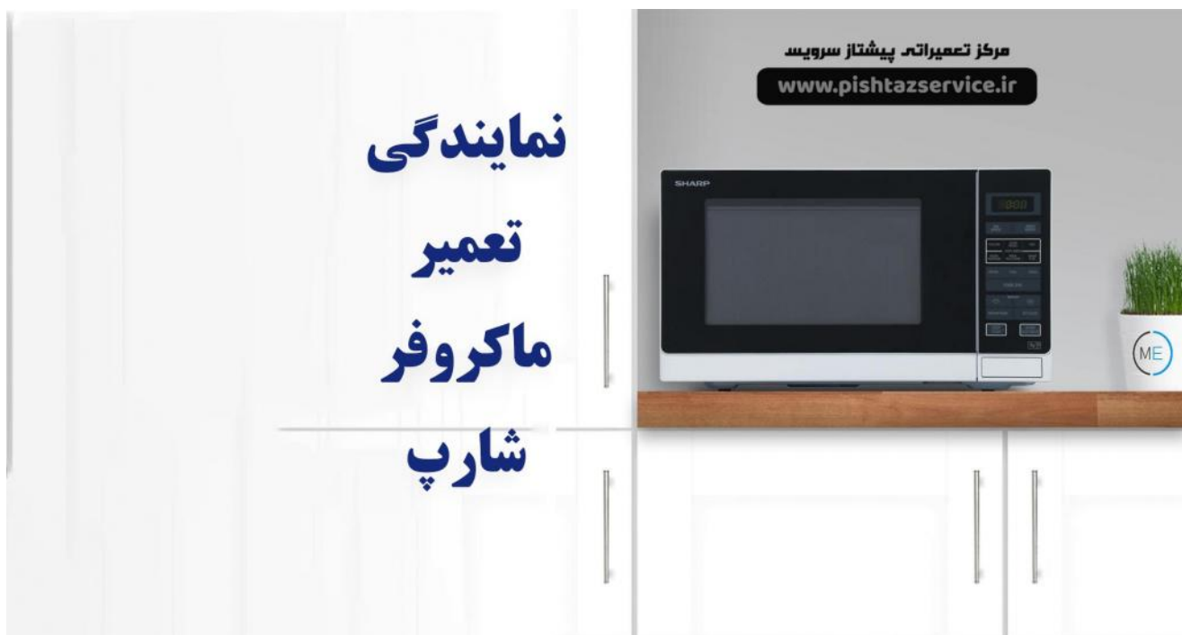
نمایندگی تعمیر ماکروفر شارپ

موارد ذکر شده در متن فوق می تواند از عوامل جرقه زدن دستگاه مایکروفر شارپ شما باشد که پیشتاز سرویس در ادامه این مقاله سعی بر بالا بردن اطلاعات شما مشتریان عزیز در رابطه با جرقه زدن مایکروفر شارپ شما عزیزان را دارد. تنها با یک تماس هنگام مواجه با مشکلات بیان شده می توانید از نمایندگی تعمیر ماکروفر شارپ کمک بگیرید.