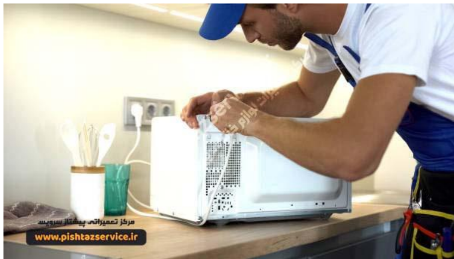
تعمیر مایکروفر در محل

1. پاسخ به این سوال طبیعتا خیر می باشد موارد دیگری مثل خازن و دیود و ترانس و برد ال و... همگی باید به درستی عمل کنند تا دستگاه عمل گرم کردن را به درستی انجام دهد ولی عموما خرابی از قطعه مگنترون می باشد اما همانطور که ذکر شد نه قطعا.