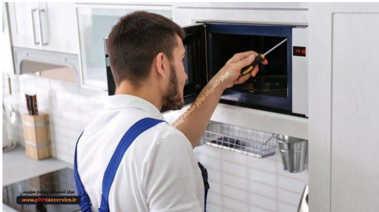
تعمیر مایکروفر در محل

قرارگیری مایکروفر در مجاورت اجاق گاز و یا نزدیک به شلنگ گاز از محل های بسیار پرخطر می باشد که در برخی از درخواست های تعمیر مایکروفر در محل مشتری درخواست تعویض بدنه مایکروفر را به علت سوختگی یا آب شدن دارد.