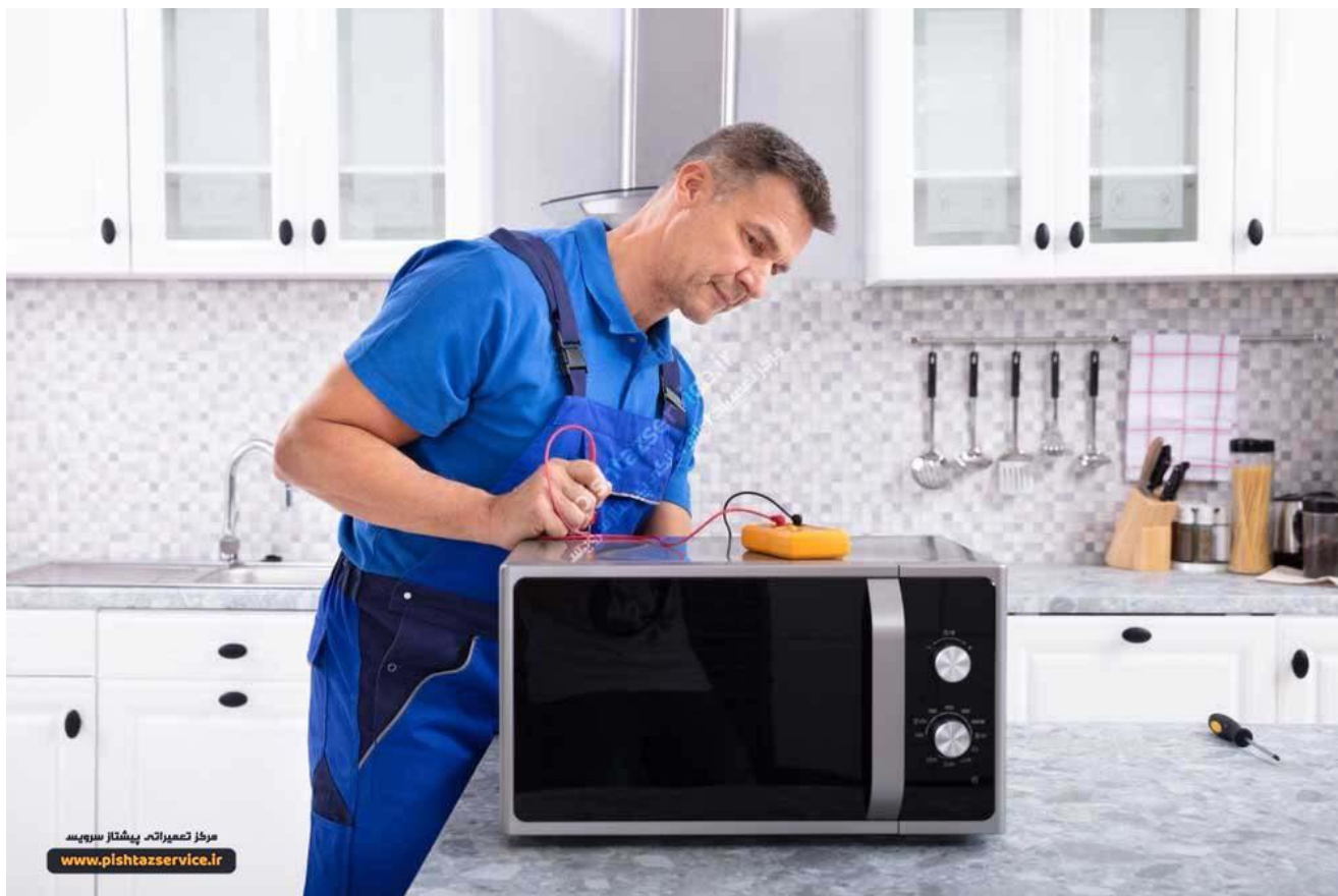
تعمیر ماکروفر در محل

بعضی از مشتریان هنگام اعزام تکنسین به محل برای تعمیر دستگاه ، دغدغه بهترین بودن از نظر امانت داری ، صداقت ، استفاده از قطعات اصلی و با توجه به وضعیت فعلی کشور و شیوع ویروس کرونا ، تمیزی و پاکیزه بودن را دارند.