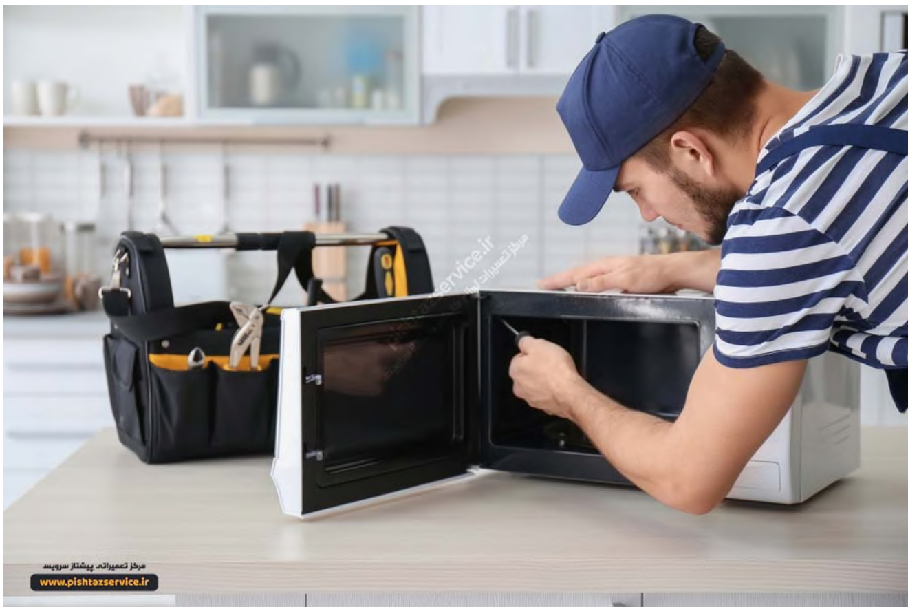
تعمیر ماکروفر در محل