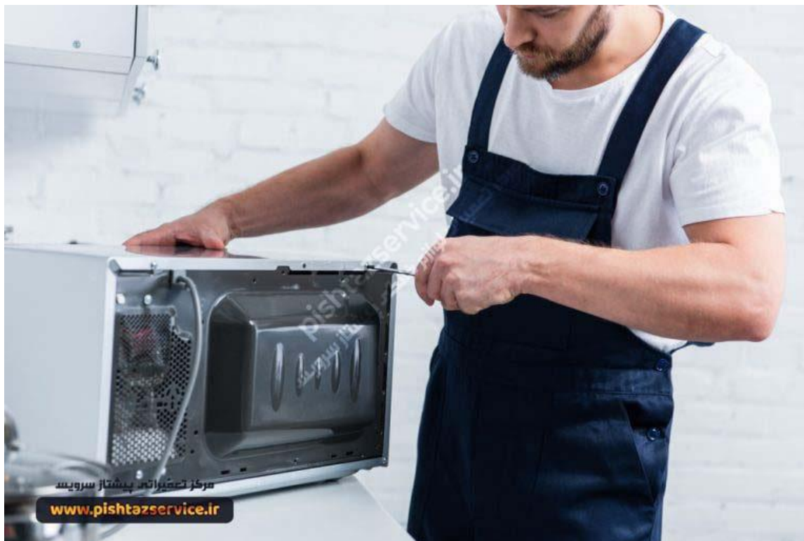
تعمیر مایکروفر در محل

برای تعمیر مایکروفر در محل می توانید از طریق ثبت سفارش و درج آدرس خود در سایت و یا با تماس با خطوط ارتباطی پیشتاز سرویس درخواست خود را ثبت کنید تا تکنسین های پیشتاز سرویس با شما در ارتباط باشند.