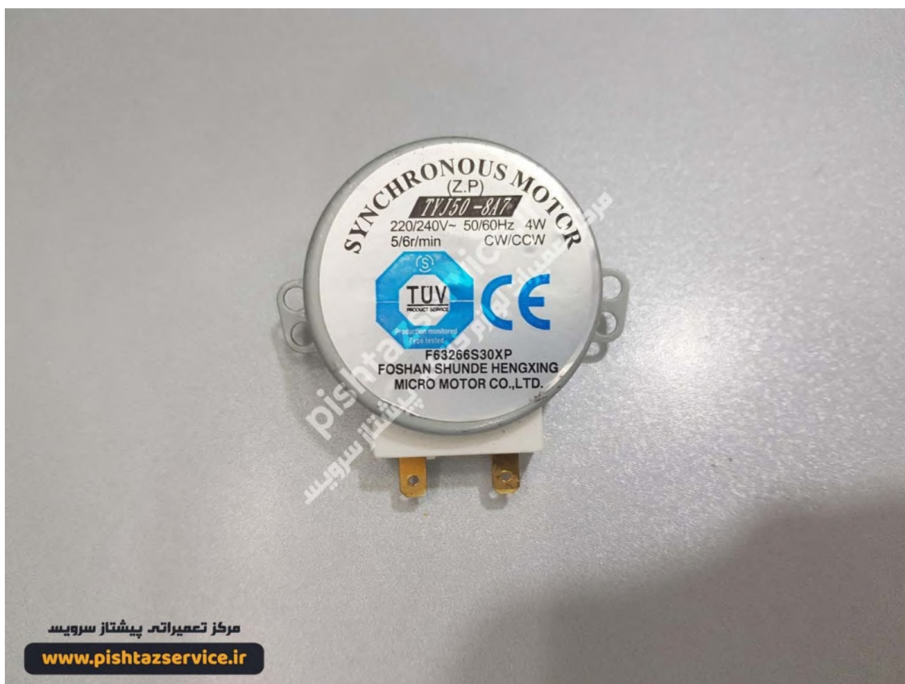
تعمیر مایکروفر بوش

خرابی شفت کویلینگ یا ریل به صورت ظاهری قابل مشاهده می باشد ولی برای تست موتور گردان احتیاج به باطری تست داریم که برای رفع این خرابی نیز می توانید با مرکز تعمیر مایکروفر بوش پیشتاز سرویس تماس حاصل نمایید.