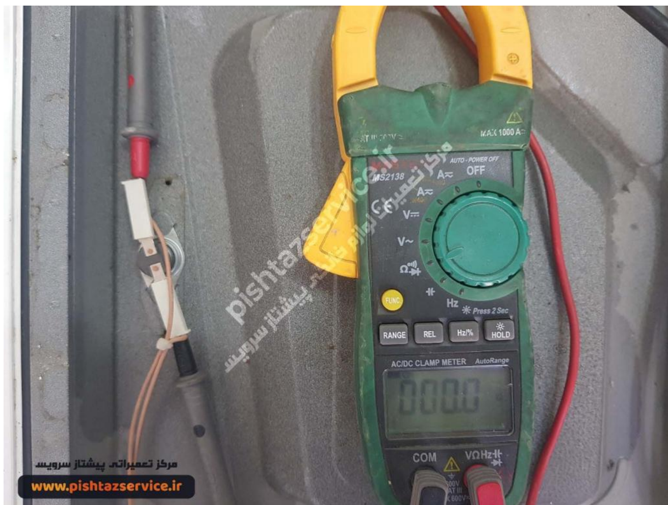
تعمیر مایکروفر پوش (تست اهمی ترموستات محافظ مایکروفر پوش)

این مقاله پاسخگوی سوال شما نبود؟ می‌توانید مستقیماً با کارشناسان پیشتاز سرویس تماس بگیرید و از مشاوره رایگان ما استفاده کنید.