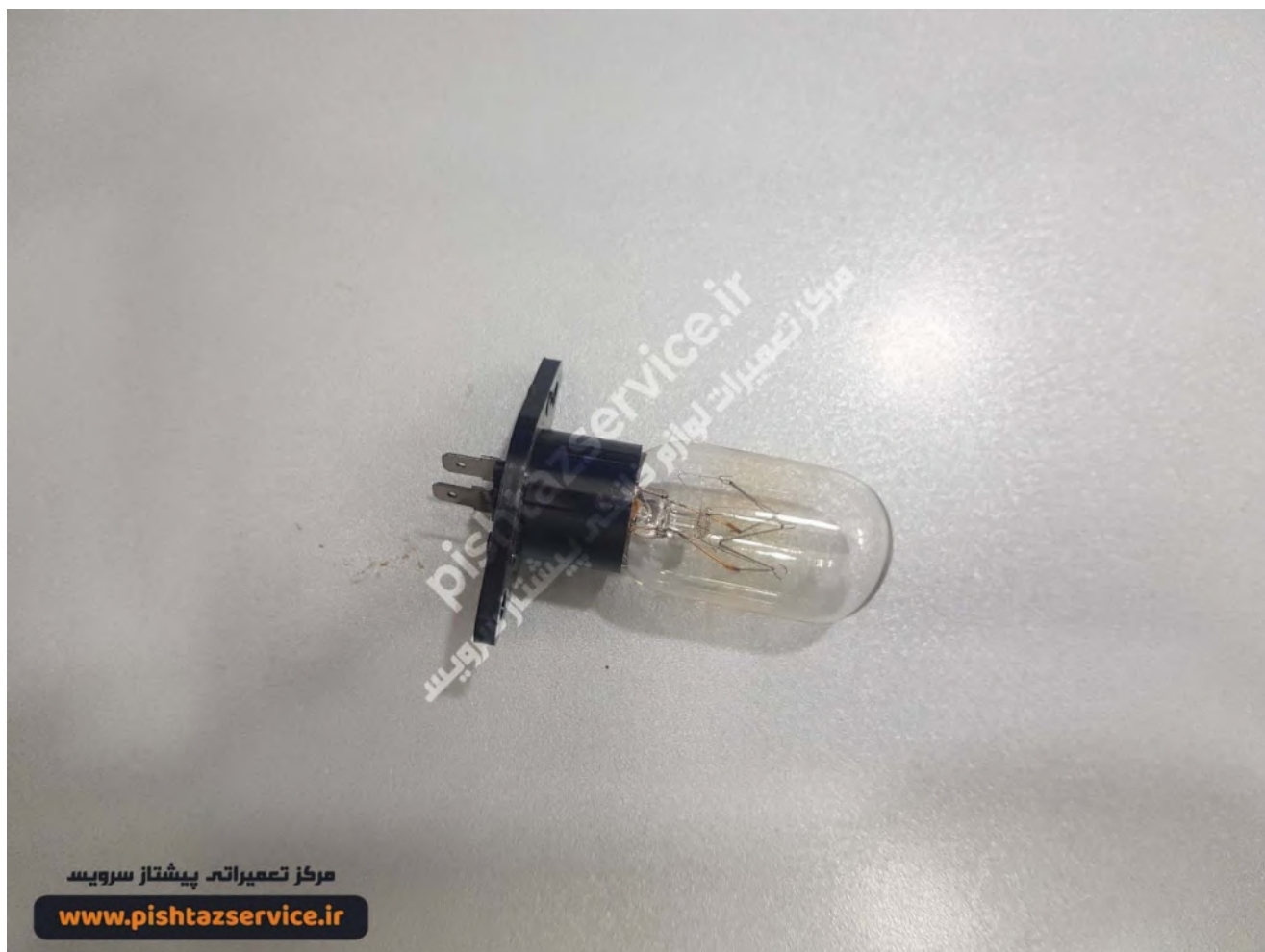
تعمیر مایکروفر بوش (لامپ روشنایی مایکروفر)