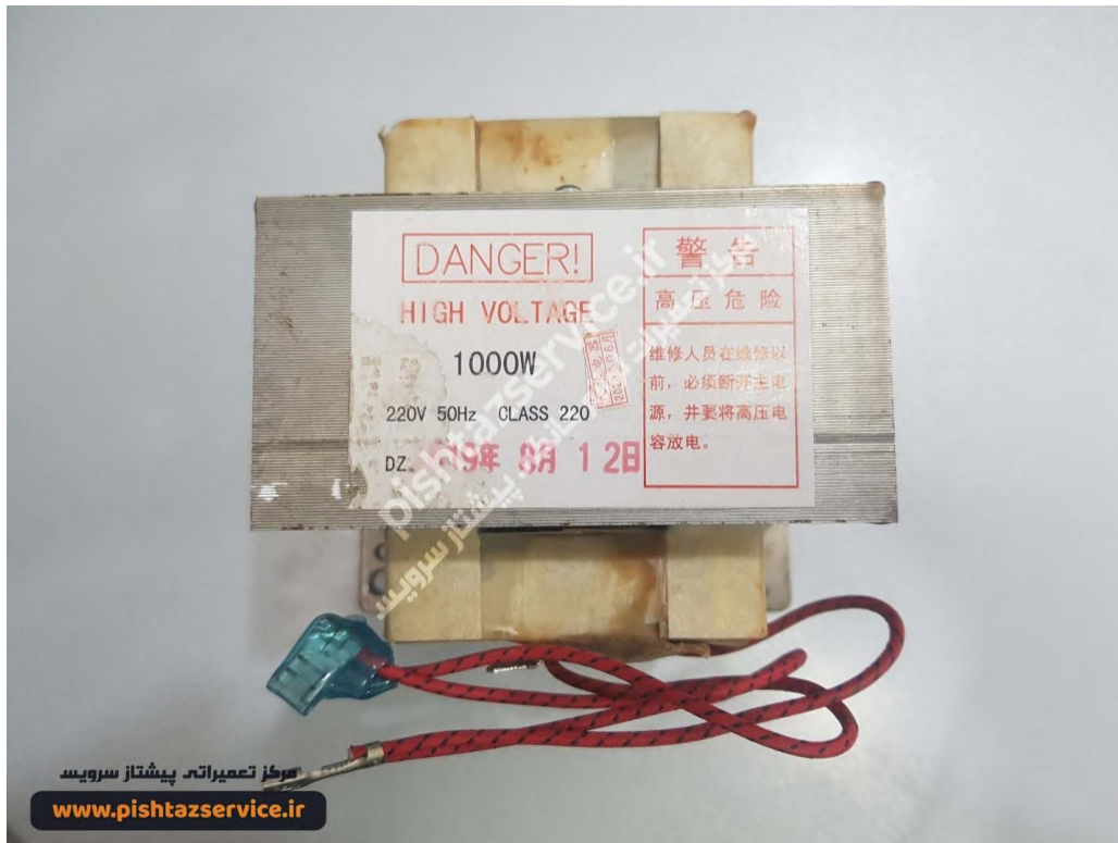
تعمیر ماکروفر بوش