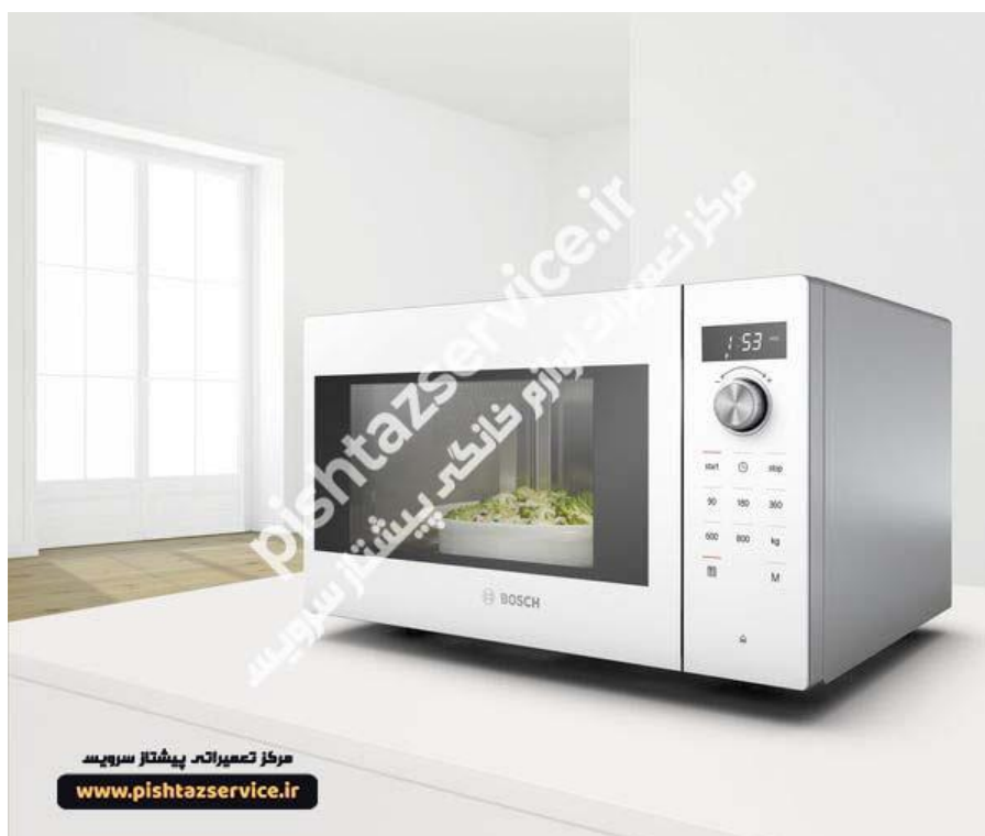
تعمیر مایکروفر بوش