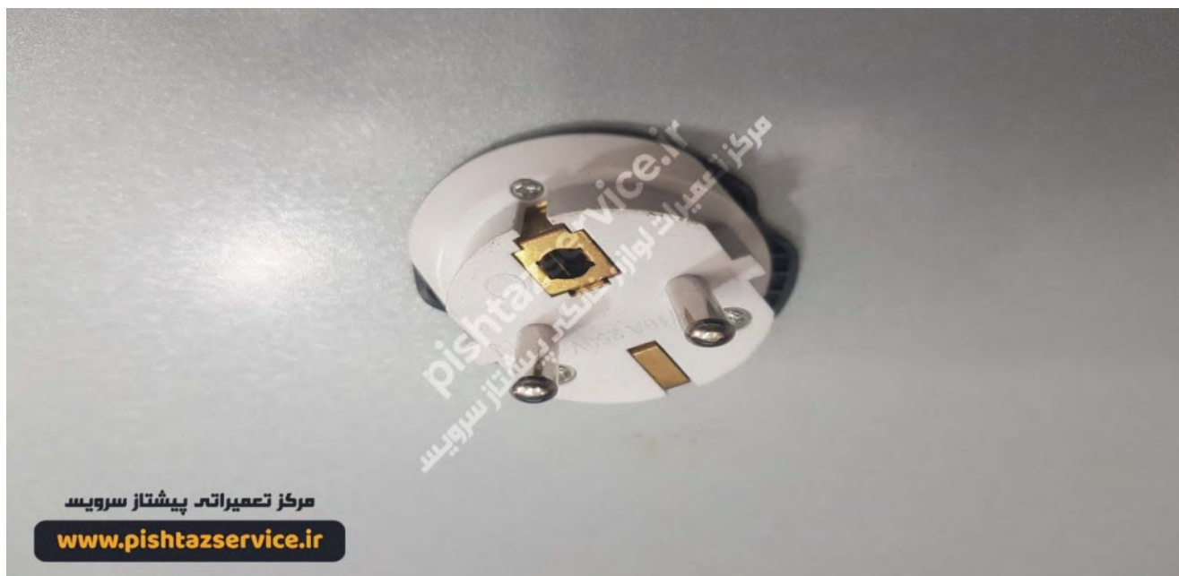
تعمیر ماکروفر بوش (دو شاخه)

2. فیوز مربوط به پریز که مایکروفر بوش شما به آن متصل است. (در تصویر پایین اگر دقت کنید در این جعبه فیوز مربوط به منزل مسکونی یکی از کلیدهای مینیاتوری عمل کرده است و خبر از بروز اتصالی در یکی از وسایل منزل می دهد که در خرابی سوئیچ درب مایکروویو بوش نیز این اتفاق حادث می شود.) شما می توانید پس از اطمینان حاصل نمودن از خرابی میکروسوئیچ مایکروویو خود با مرکز تعمیر مایکروویو بوش در تهران تماس حاصل نمایید.