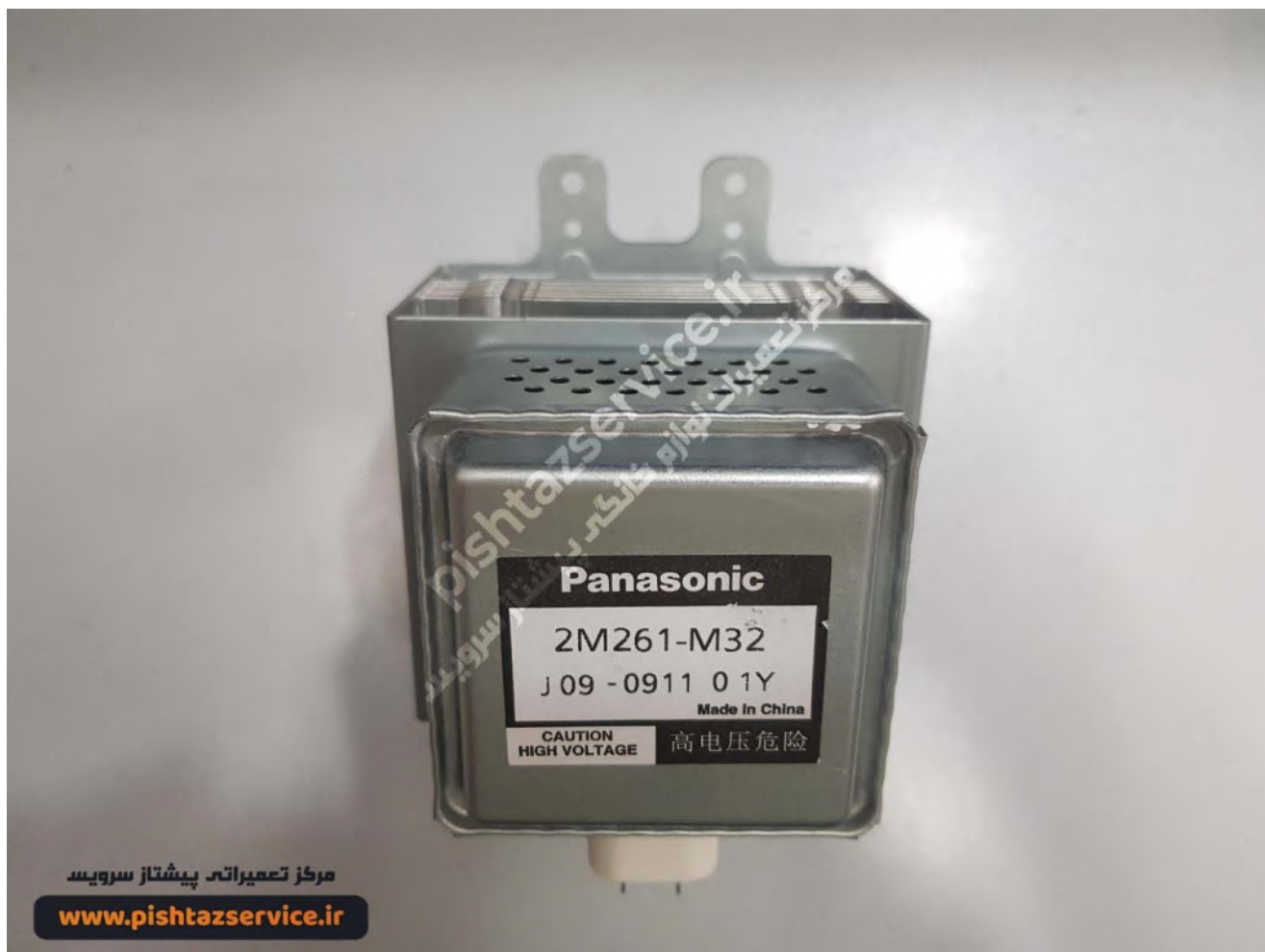
تعمیر ماکروفر بوش (مگنترون ماکروفر)

بیشترین مشکل و درخواست تعمیر ماکروفر بوش نیز همین علت می باشد زیرا با از کار افتادن هر قطعه ای این اتفاق رقم می افتد.