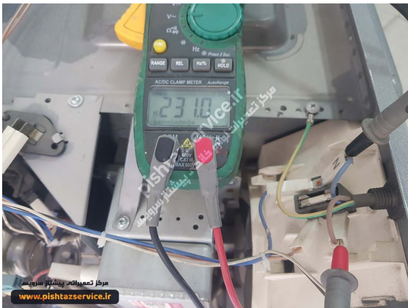
تعمیر ماکروفر بوش (اندازه گیری ولتاژ مایکروویو بوش)

4. پس از بررسی موارد فوق و اطمینان از بی عیب بودن موارد ذکر شده نوبت به تست خود دستگاه می باشد. کاور دستگاه را باز کنید و ورودی های دستگاه و ترموستات ها را با اهم متر چک کنید اگر اهم موارد محافظتی نیز درست باشد متاسفانه برد دستگاه به علت نوسانات برق سوخته است. در تصویر پایین نیز نحوه تست اهمی ترموستات محافظ مایکروفر بوش به شما آموزش داده شده است.