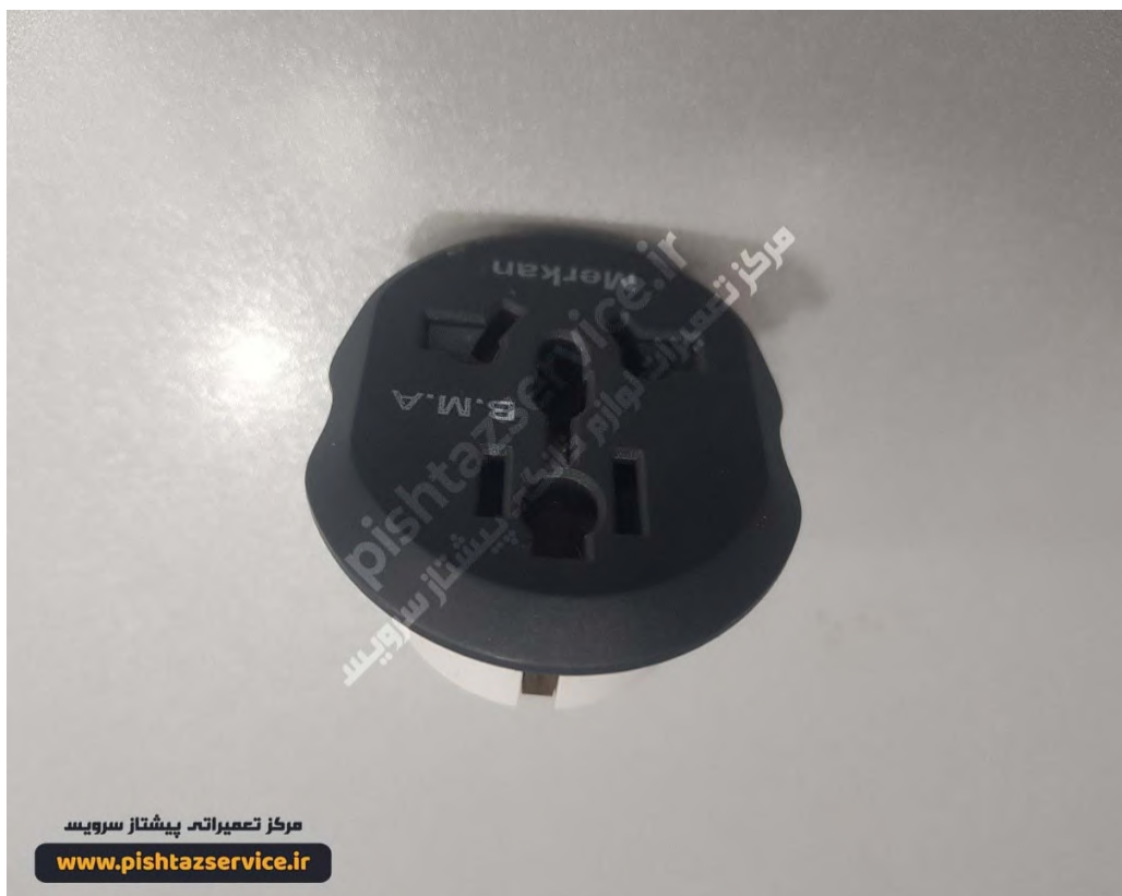
تعمیر ماکروفر بوش (تبدیل سه به دو)