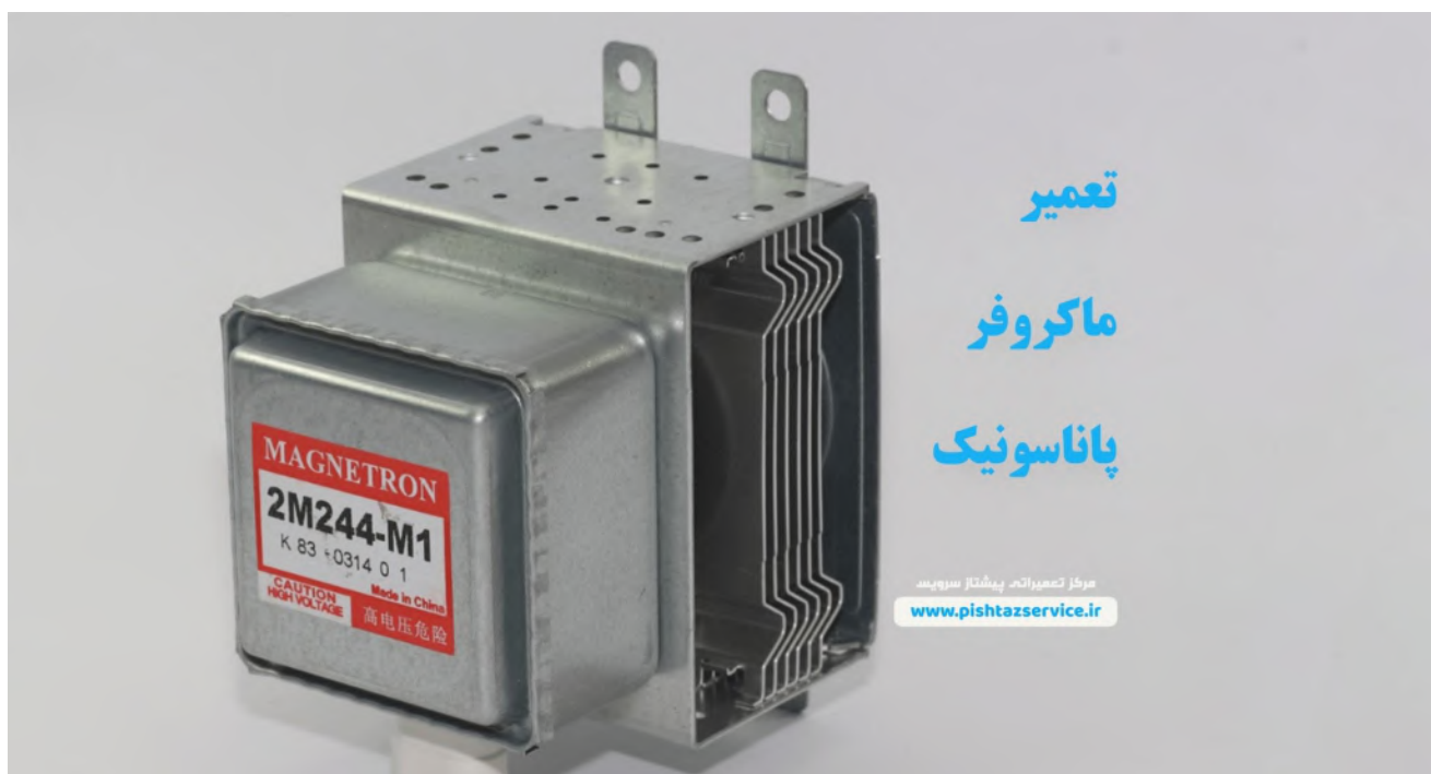
تعمیر ماکروفر پاناسونیک

در این مقاله تلاش کرده ایم عیب های متداول در دستگاه ماکروفر پاناسونیک شما را که توسط تکنسین های مجرب ما دیده شده را با هم بررسی نماییم و تجارب خود را با هم به اشتراک بگذاریم. خوشحال می شویم شما هم نظرات خود را با ما در میان بگذارید. شاید در ذهنتان این سوال به وجود بیاد که چرا پیشتاز سرویس؟