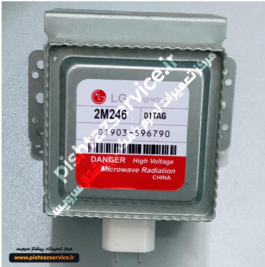
تعمیر ماکروفر ال جی در تهران (مگنترون ماکروفر)