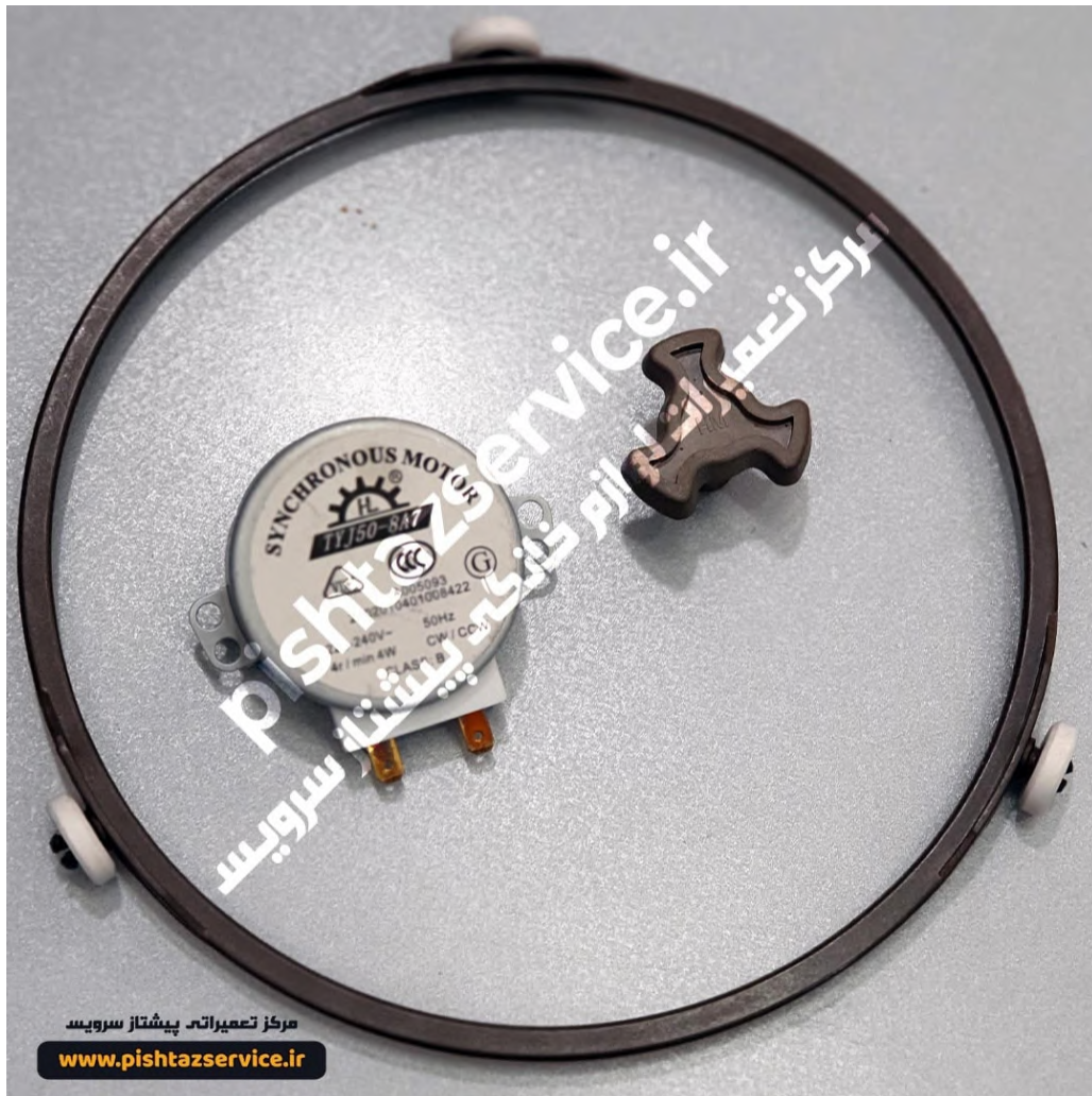
تعمیر ماکروفر ال جی در تهران (گرداننده و موتور کف سینی)