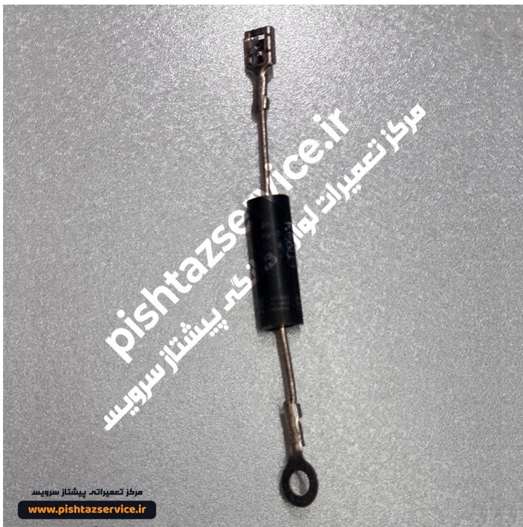
تعمیر ماکروفر ال جی در تهران (دیود ماکروفر)

در مورد تعمیر ماکروفر ال جی خود سوالی دارید؟ سوال خود را کامنت کنید تا کارشناسان پیشتاز سرویس در اولین فرصت پاسخگوی سوال شما باشند.