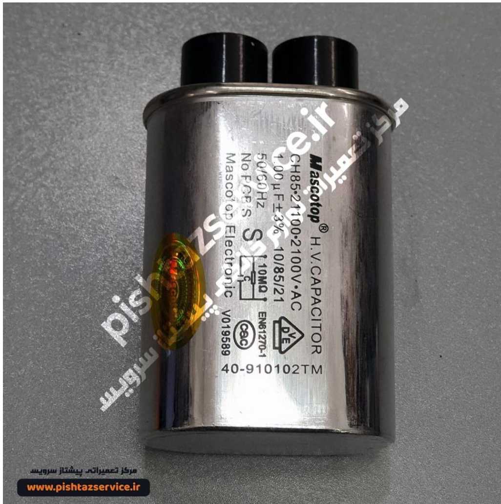
تعمیر ماکروفر ال جی در تهران (خازن ماکروفر)